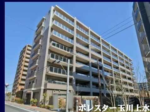
ポレスター玉川上水

●所在地/東大和市桜が丘二丁目 ●交通/西武拝島線 玉川上水駅 徒歩6分・多摩モノレール線 玉川上水駅 徒歩6分 ●土地権利/所有権 ●地目/宅地 ●都市計画/市街化区域 ●用途地域/工業地域 ●敷地面積/2355.59m 2 (持分8164/449801) ●専有面積/81.64m 2 (24.69坪) ●築年月日/平成24年5月新築 ●建物構造/鉄筋コンクリート造 陸屋根 8階建 ●設備/東京電力・公営水道・公共下水・都市ガス・エレベータ・オートロック・宅配ボックス・無料電動レンタルサイクル・駐車場(有料) ●現況/空家 ●取引形態/代理 ●広告有効期限/2020年2月末まで ※図面と現況が相違する場合は現況優先とさせていただきます。