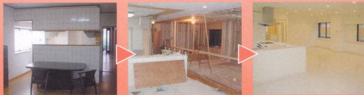
中古住宅の状態から、ご希望の完成イメージをお打ち合わせ、設計いたしました。 設計プランに基づいた、無駄の無い解体・施工作業。 堂々完成!白を基調とした広〜いLDKにリチェンジ

リチェンジ・リフォームの実例をご紹介します。それぞれが建築士のこだわりと、用途・目的に合わせたプランニングで施工しております。