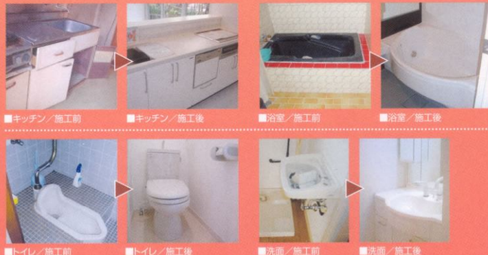
■キッチン/施工前 ■キッチン/施工後 ■浴室/施工前 ■浴室/施工後 ■トイレ/施工前 ■トイレ/施工後 ■洗面/施工前 ■洗面/施工後